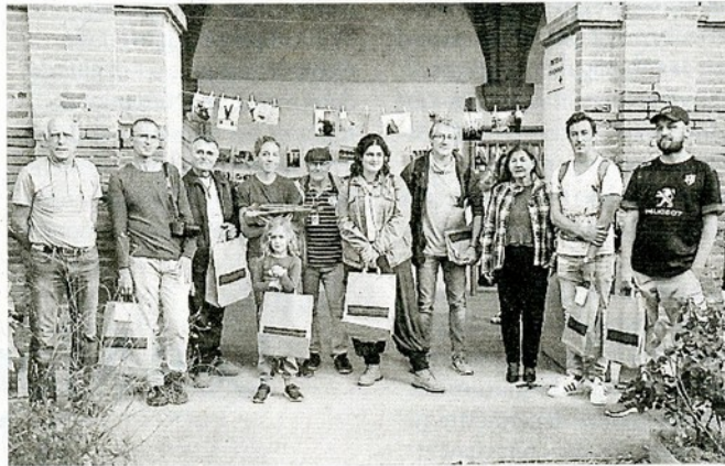
Lauréats et jury pour la photo finale.

Pas une compétition mais l'occasion de s'exprimer sur un thème de confronter sa vision, le 11e marathon photographique organisé par l'association Photo Création Communication a éparpillé dans les rues ensoleillées de la ville ce samedi les photographes amateurs de tous âges. 3 thèmes successifs à traiter en 1 h 30 chacun : » La tête en bas » puis « Juste un peu de flou » et pour finir « Ici l'ombre ». 77 concurrents ont laissé parler leur imagination et leur talent. Les tirages aussitôt réalisés par